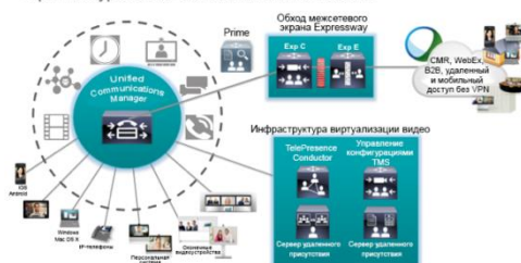
Архитектура Cisco Collaboration Architecture

Чтобы преуспеть в современном стремительно развивающемся мире, предприятия должны иметь возможность взаимодействовать и обмениваться информацией независимо от местонахождения, используя любые доступные устройства, через любые сетевые подключения, экономичным, надежным и безопасным способом. Решение Cisco Unified Communications Manager версии 10.x/11.x является лидером среди платформ по обработке вызовов клиентов и управлению сеансами. Компания Cisco гарантирует непревзойденное удобство работы как для пользователей, так и для администраторов, обеспечивая при этом поддержку полного спектра услуг по организации совместной работы, включая услуги связи по видео и голосовым каналам, услугу для обмена мгновенными сообщениями и контроля присутствием IM and Presence, а также услуги по обеспечению мобильности как на устройствах как Cisco, так и сторонних производителей.